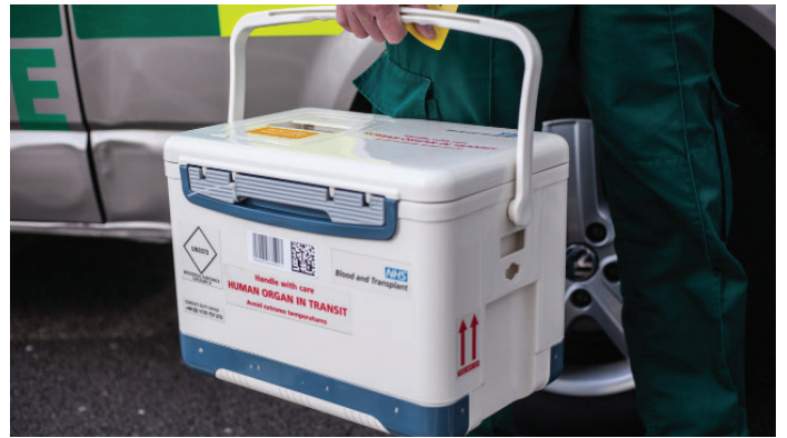
Blut- und Organtransporte