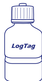
Puffersystem nicht enthalten (Kieselsand empfohlen für Temperaturen unter -40 °C)