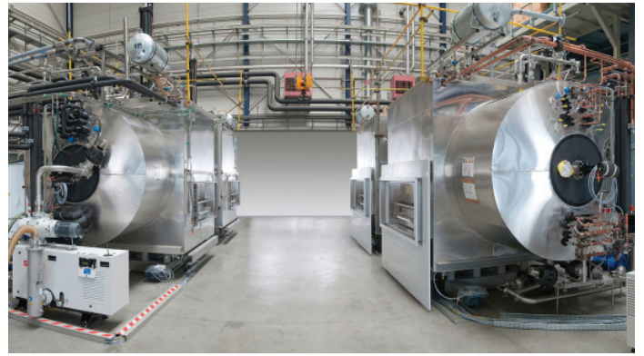
Auslieferungen in der Produktion