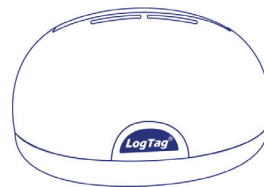
LTI-HID Nicht enthalten