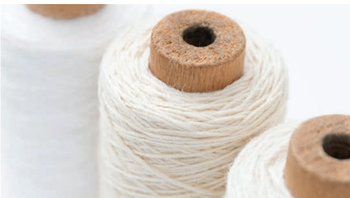
Holz und Textilien