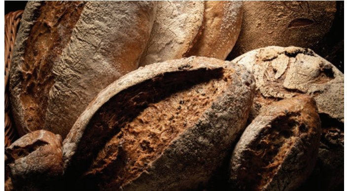
Lebensmittel und Erzeugnisse